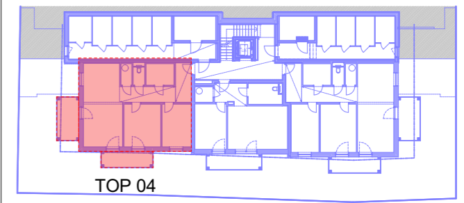
ÜBERSICHT 1.OBERGESCHOSS 1/500